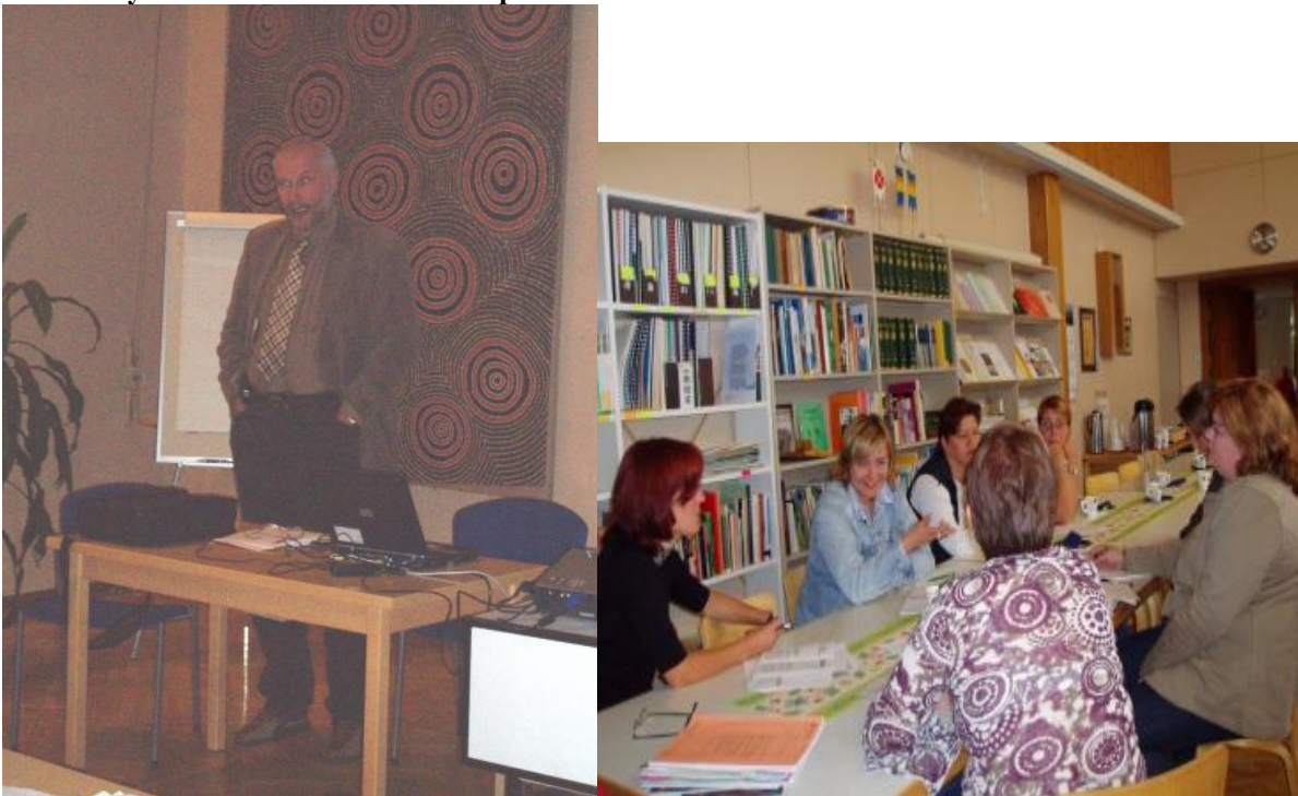
Kuva 4. Ryhmätöitä KUUMA kierre -tapahtumassa