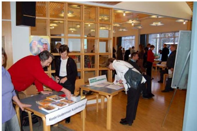
Keski-Uudenmaan ensimmäinen yhteisöllisyyspäivä

Keski-Uudenmaan yhteisöllisyyspäivää vietettiin ensimmäistä kertaa talvella 2009. Päivän tarkoituksena oli edistää eri toimijoiden verkostoitumista sekä saada tietoa mm. vapaaehtoistyöstä, yhteisöllisyydestä ja sosiaali- ja terveysjärjestöistä. Annetussa palautteessa erityisen positiivisena pidettiin sitä, että oli mahdollisuus tutustua toisiin järjestöihin ja että yhdessä tekeminen kannattaa. Päivän aikana olisi saanut olla enemmän kävijöitä, minkä lisäksi toivottiin muidenkin järjestöjen voivan osallistua sosiaali- ja terveystoimien ohella. Kokonaisuutena tapahtuma oli kuitenkin tärkeä yhteistyön areena. Yhteisöllisyyspäivä tullaan toteuttamaan vuosittain ympäri KUUMA-seutua. Tulevina vuosina tilaisuus on tarkoitus rakentaa niin, että se houkuttelee paremmin paikalle kuntalaisia ja kuntien edustajia.